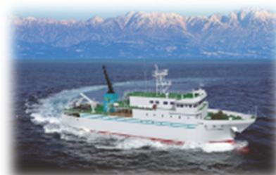
若潮丸V世 完成イメージ図

さて、本校練習船「若潮丸」は、昭和32年の初代若潮丸の就航以来、現在の若潮丸IV世まで一貫して世界の物流を支える若者の育成に貢献してまいりました。文部科学省をはじめ広く社会から高評価を得ています「次世代の海洋人材の育成に関する事業」においても、若潮丸は重要な役割を担っており、学生達が生き活きと学び、訓練に励んでいます。